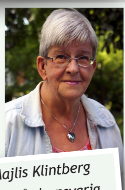
Majlis Klintberg Trädgårdsansvarig