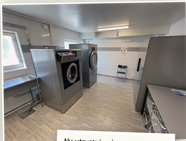
Ny utrustning i grovtvättstugan på Herrgårdsvägen 12

Grovtvättstugan har fått en uppfräschning och är nu åter öppen för bokning. Hela tvättstugan är totalrenoverad och helt nya maskiner har installerats. För att boka gör du på vanligt sätt via informationstavlan eller appen Apts Home. Grovtvättstugan hittar du sedan med ingång från baksidan av Herrgårdsvägen 12.