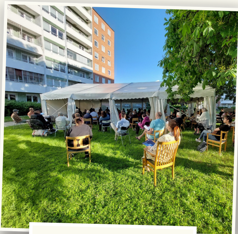
Bilder från föreningens årsstämma den 15 juni

Totalt hade 15 st. motioner inkommit och samtliga behandlades på årsstämman. Vi vill tacka alla som medverkade och bidrog till en bra och demokratisk stämma.