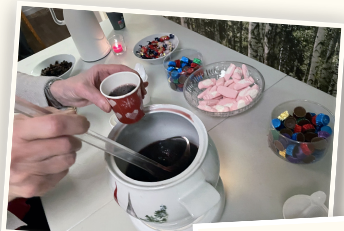
Föreningens julfika 2022

Den 12 december bjöd styrelsen in samtliga boende till en trivselkväll med julfika i vår föreningslokal. Denna kväll har varit ett efterlängtat event som vi tyvärr inte haft möjlighet att arrangera de senaste åren på grund av pandemin. Styrelsen informerade under kvällen lite om vad vi har för planer för framtiden och det bjöds även på julfika vilket var mycket uppskattat från samtliga. Vi vill tacka alla som medverkade denna kväll och hoppas att snart kunna arrangera fler trivselkvällar för medlemmarna.