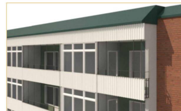
Balkonger Herrgårdsvägen 24-26, 28-32, 34.

Väggen in mot lägenheten kommer inte att göras något åt i detta projekt.