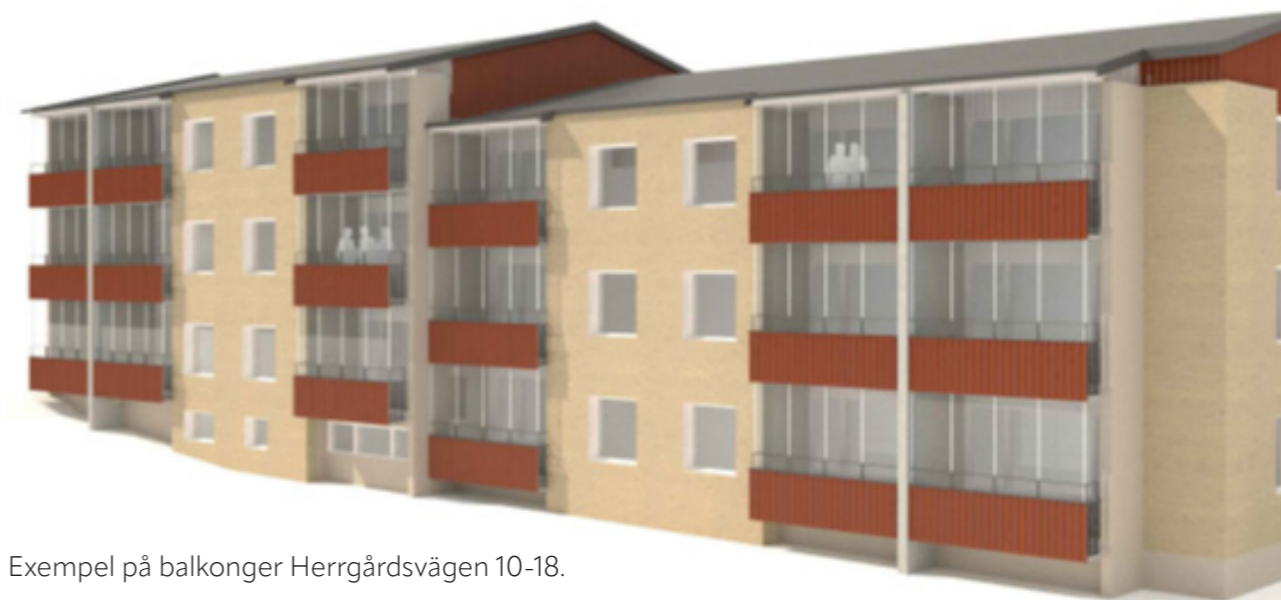
Exempel på balkonger Herrgårdsvägen 10-18.